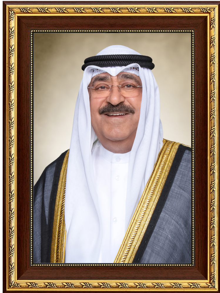
حضرة صاحب السمو الشيخ مشعل الأحمد الجابر الصباح أمير دولة الكويت